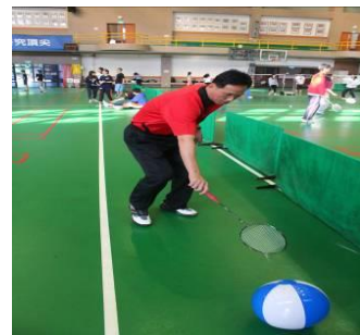
圖二十四 邊走邊推