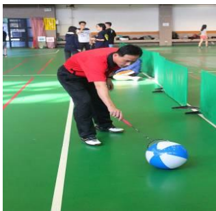
圖二十二 反拍準備