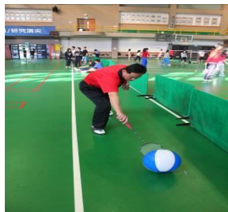
圖二十三 反拍往前推