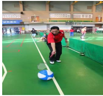
圖二十 正拍往前推